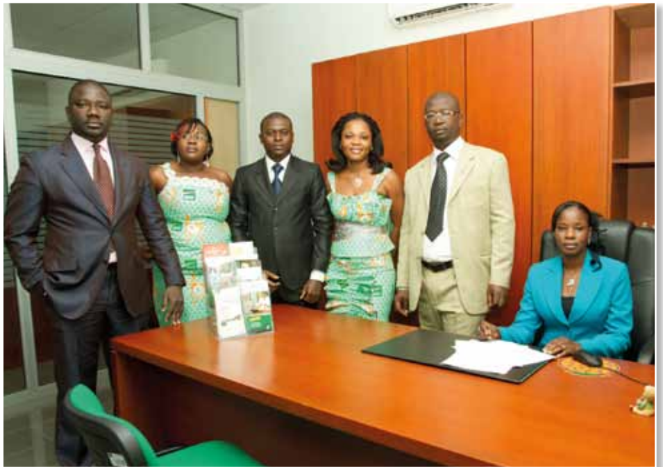
Equipe BNI ABENGOUROU

Notre rôle s'inscrit dans celui de la Direction Générale. C'est-à-dire : améliorer le taux