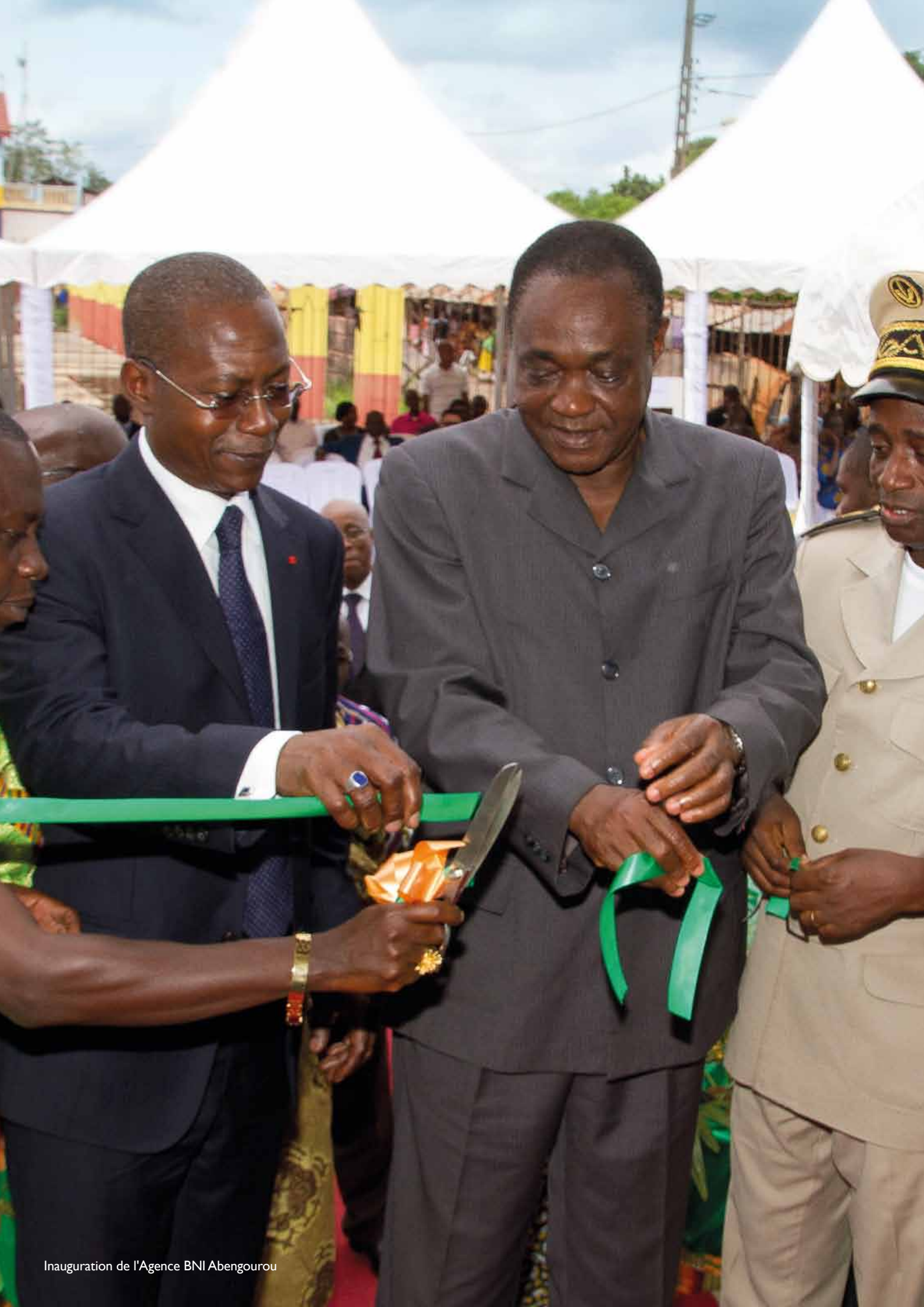
Inauguration de l'Agence BNI Abengourou