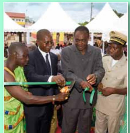
Coupe du ruban marquant l'ouverture officielle de l'agence

Rendez-vous le mois prochain pour de nouvelles actions de la DCPR !