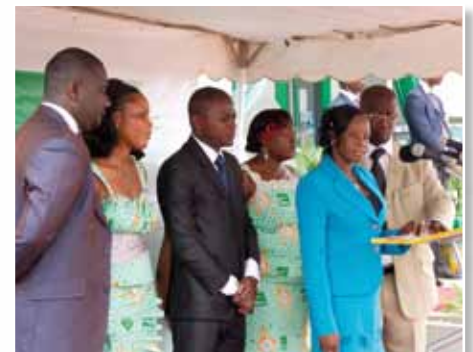
Equipe BNI ABENGOUROU

La BNI est une banque de référence et d'avenir.