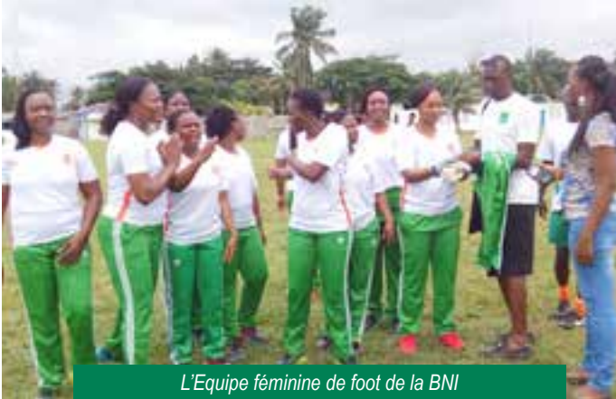
L'Equipe féminine de foot de la BNI