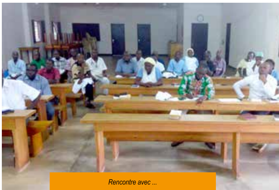
Rencontre avec ...