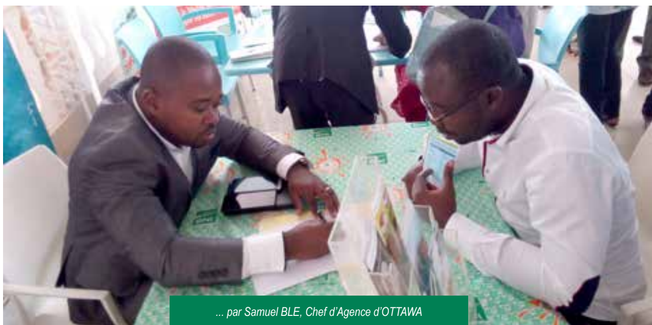
... par Samuel BLE, Chef d'Agence d'OTTAWA