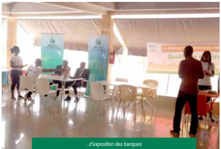
..d'exposition des banques