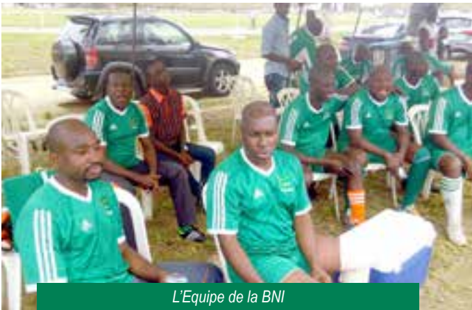
L'Equipe de la BNI