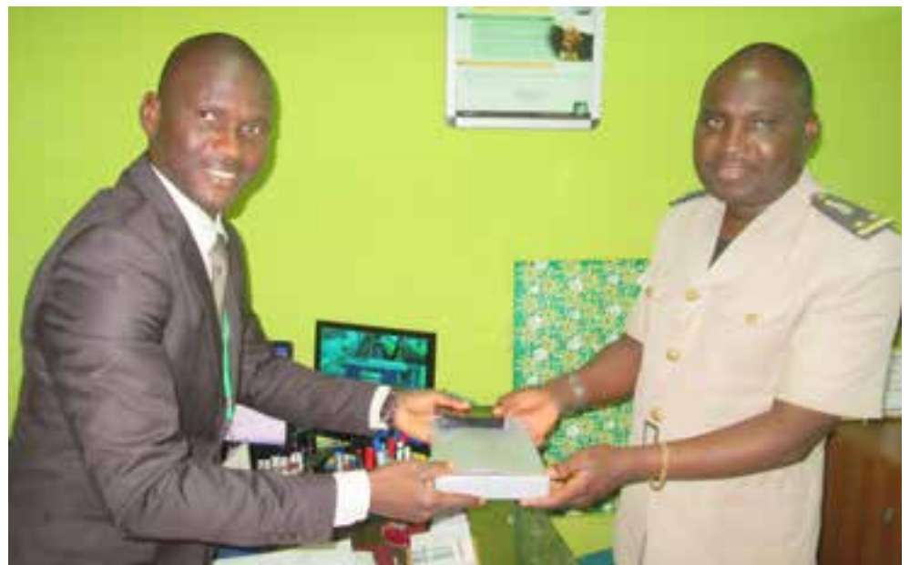
Remise de gadgets au Sous Prefet, lors de sa visite en Agence