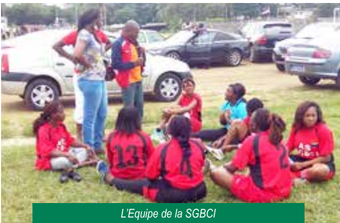
L'Equipe de la SGBCI