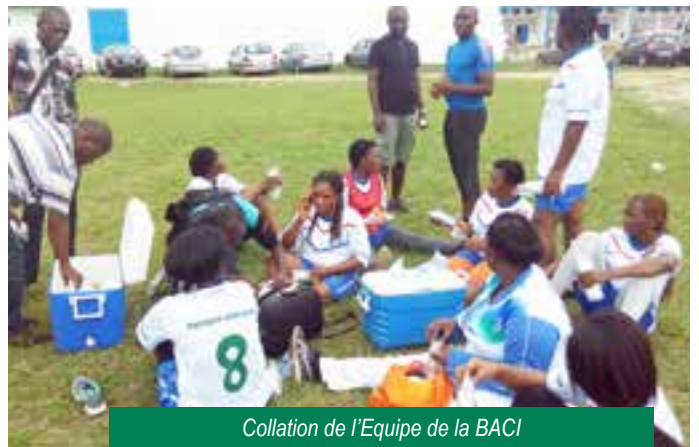
Collation de l'Equipe de la BACI