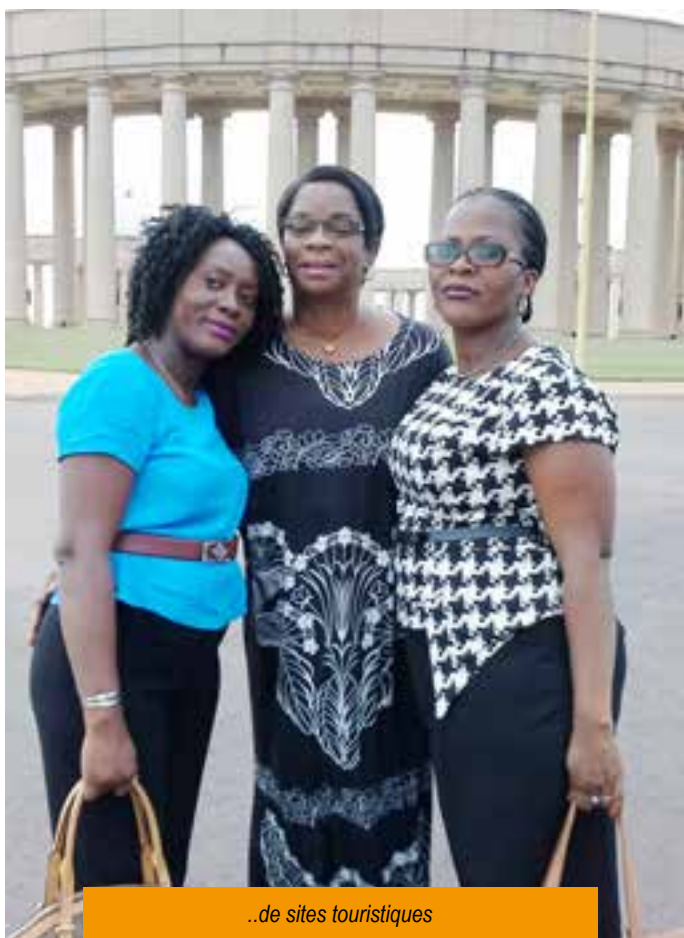
..de sites touristiques