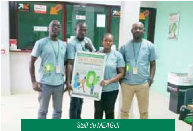
Staff de MEAGUI