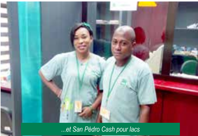
...et San Pédro Cash pour lacs