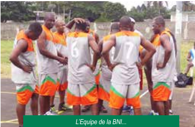
L'Equipe de la BNI...