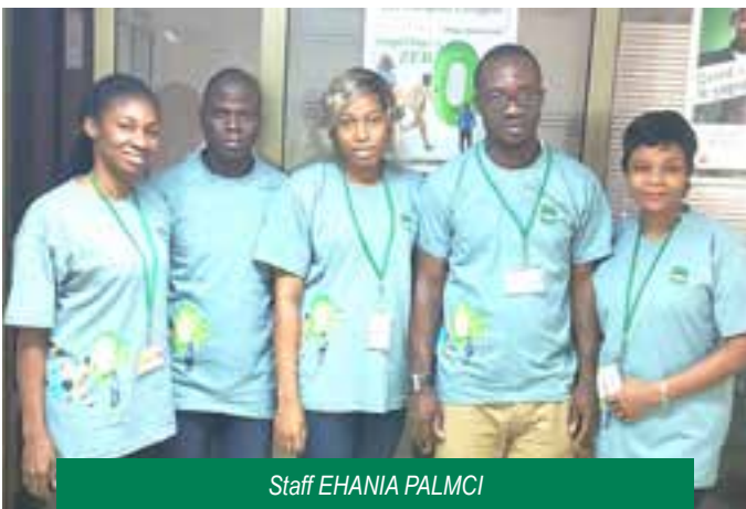
Staff EHANIA PALMCI