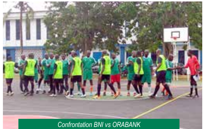
Confrontation BNI vs ORABANK