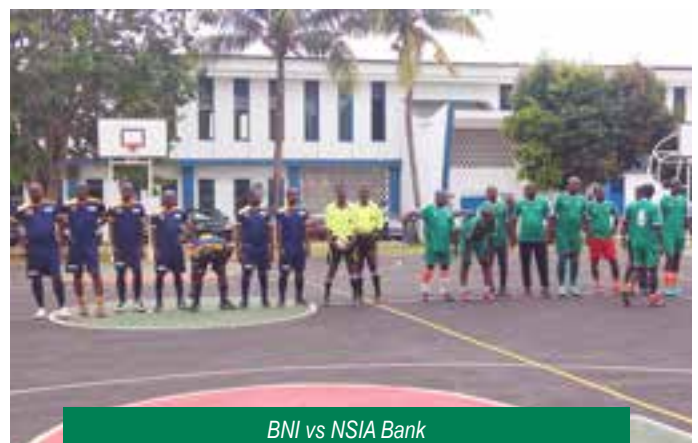
BNI vs NSIA Bank