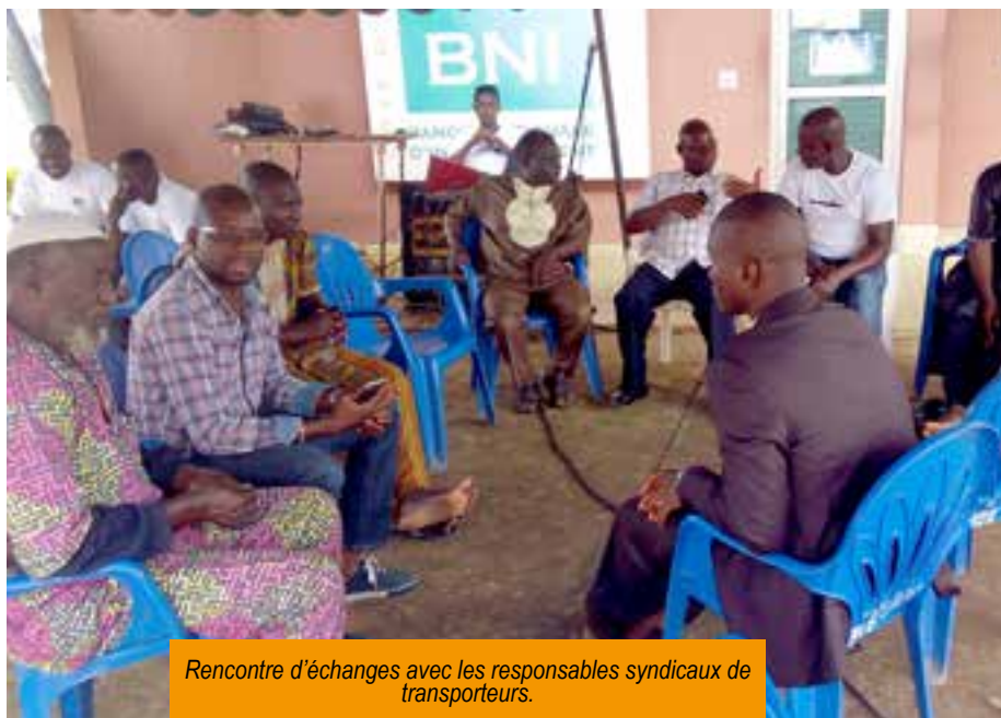
Rencontre d'échanges avec les responsables syndicaux de transporteurs.