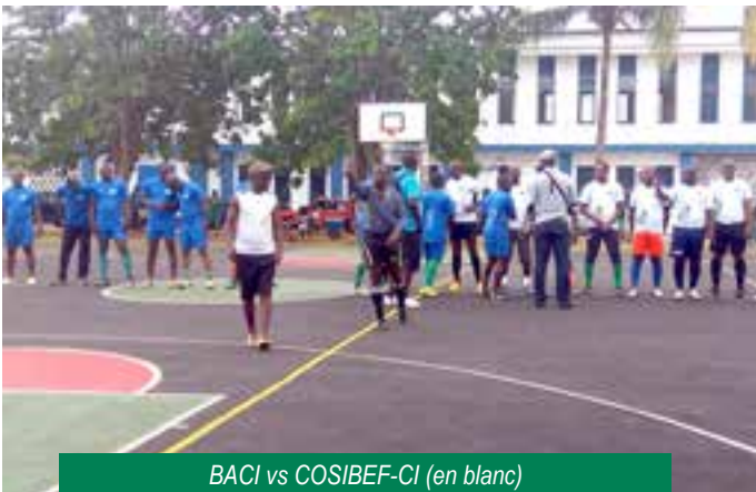
BACI vs COSIBEF-CI (en blanc)