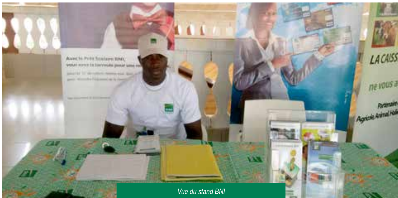
Vue du stand BNI