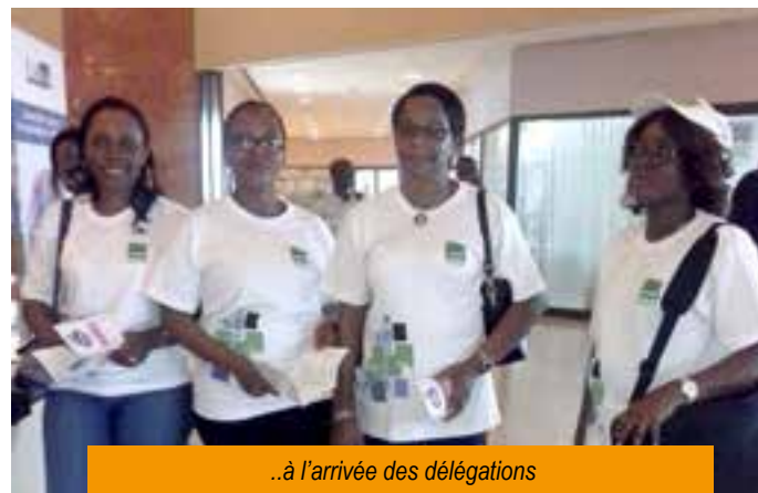
..à l'arrivée des délégations