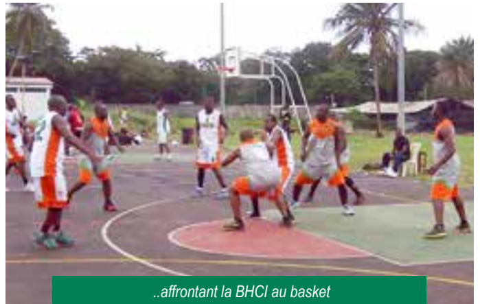
..affrontant la BHCI au basket