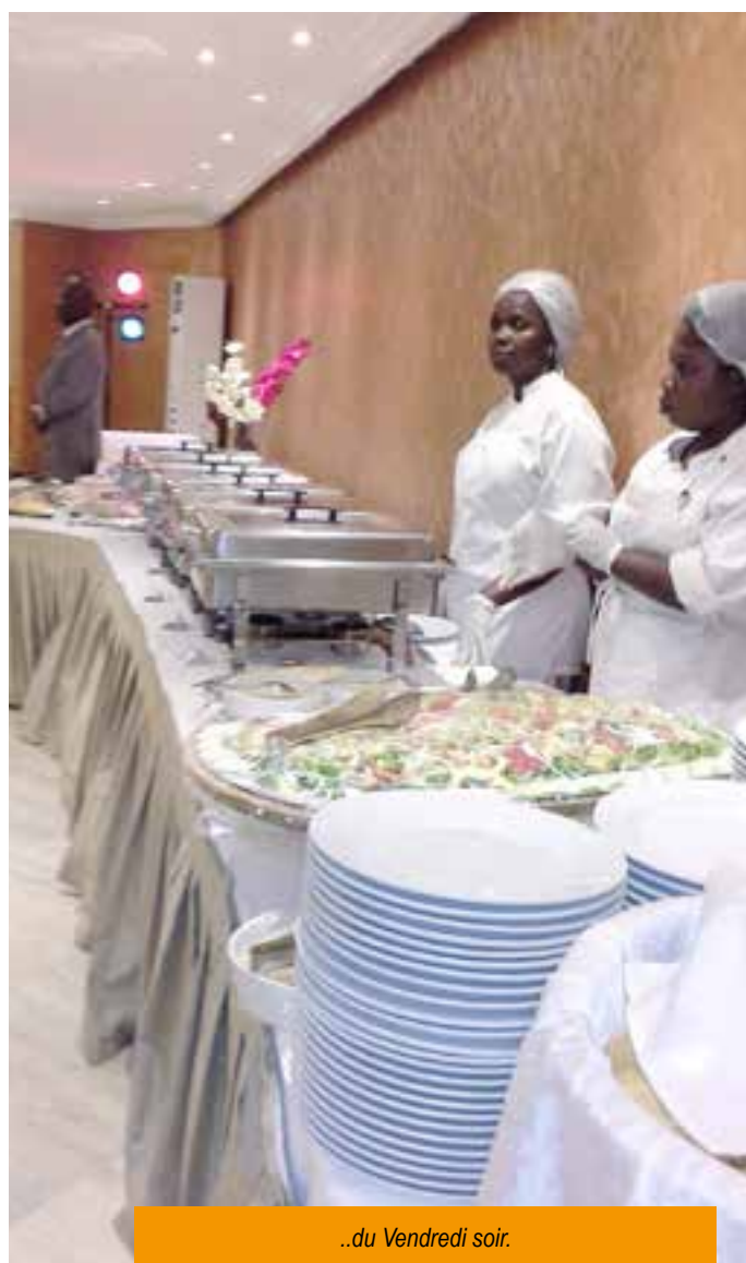
..du Vendredi soir.