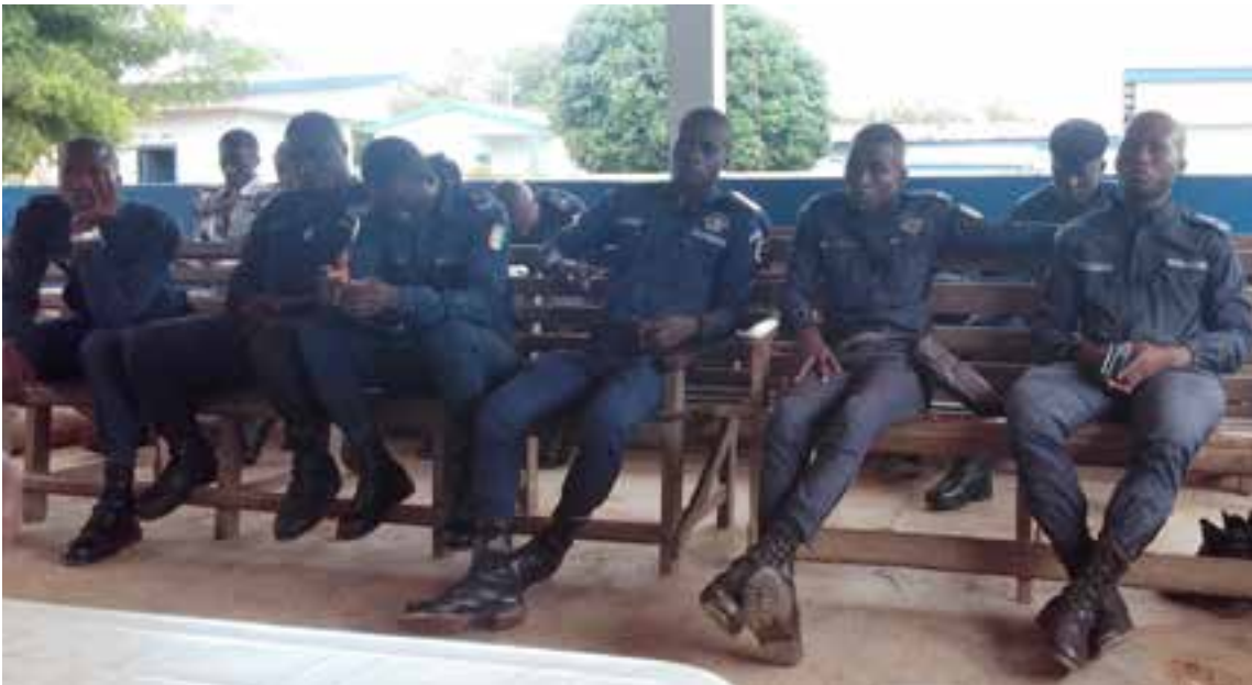
Echanges avec une unité de la Gendarmerie