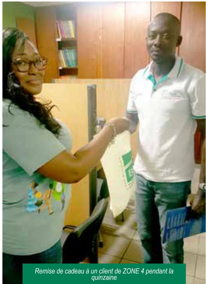
Remise de cadeau à un client de ZONE 4 pendant la quinzaine