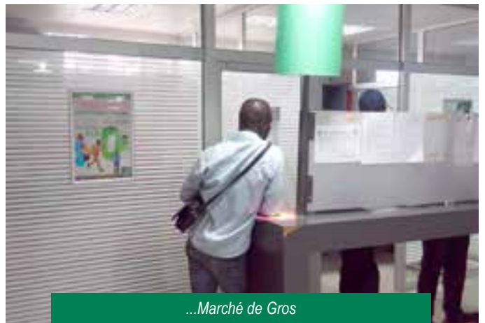
...Marché de Gros