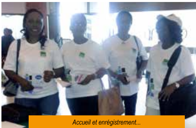
Accueil et enrégistrement...