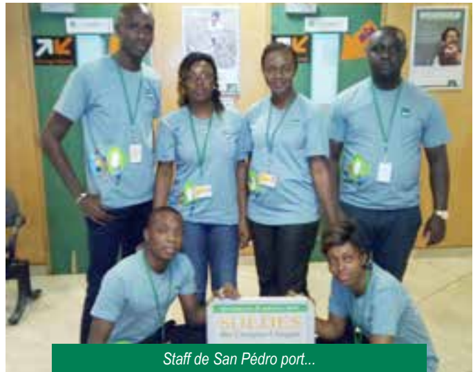
Staff de San Pédro port...