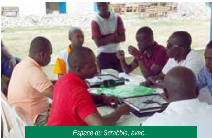
Espace du Scrabble, avec...