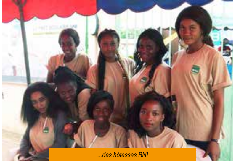
...des hôtesse BNI