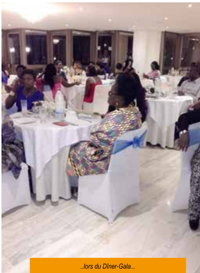
..lors du Dîner-Gala...