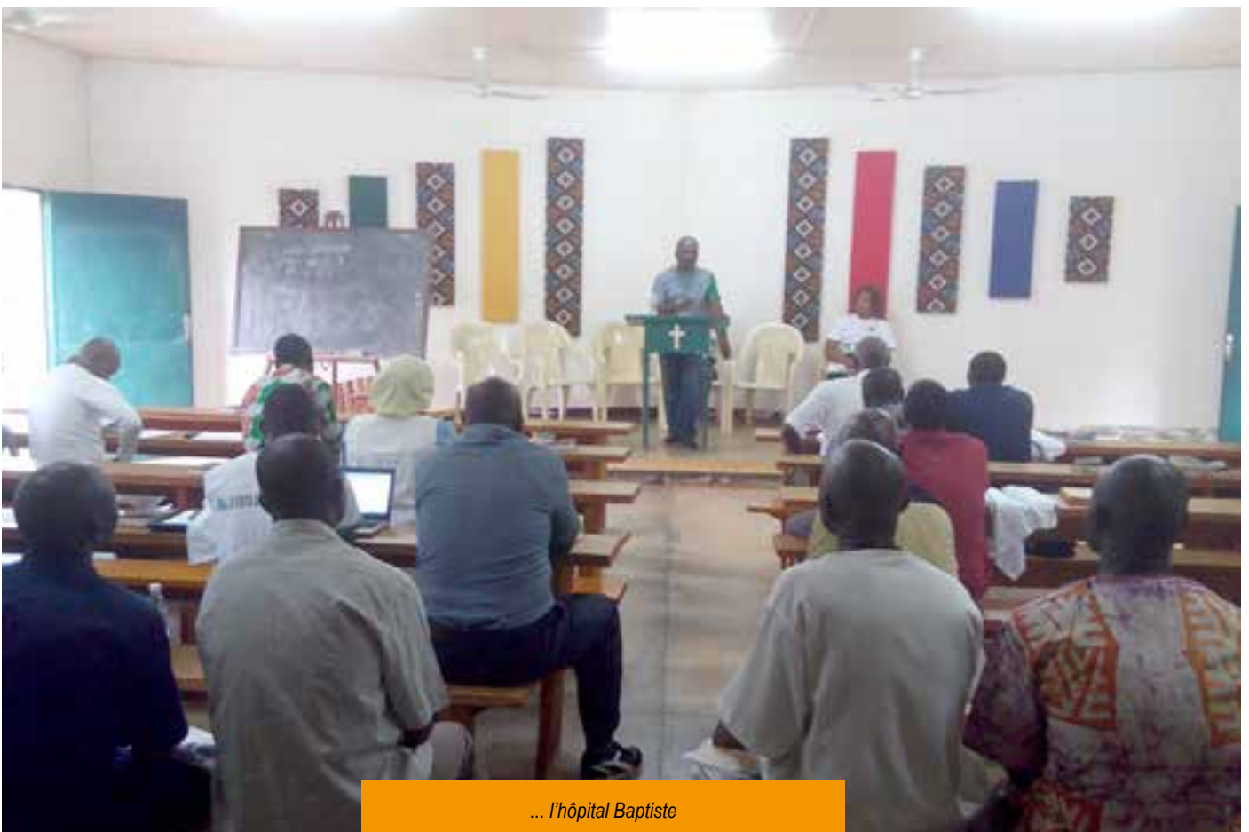
... l'hôpital Baptiste