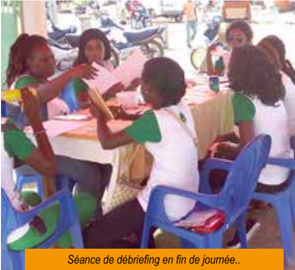
Séance de débriefing en fin de journée..