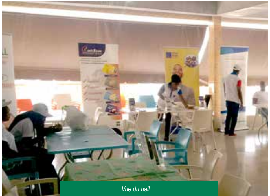
Vue du hall....

La présentation de nos produits et de nos coûts a séduit la quasi-totalité de nos visiteurs. De même, les offres relatives aux prêts ont intéressé les fonctionnaires d'une