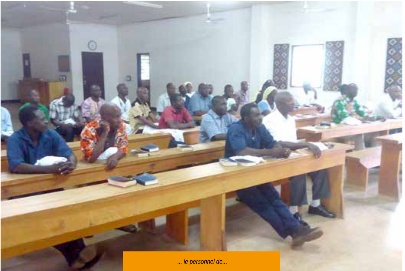
... le personnel de...