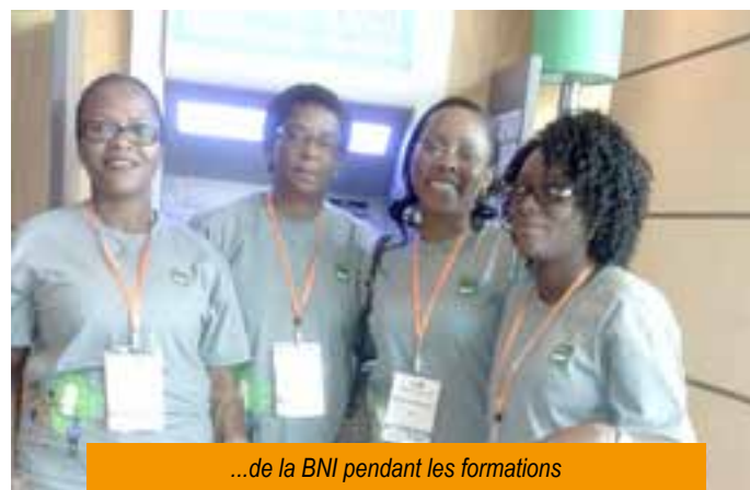
...de la BNI pendant les formations