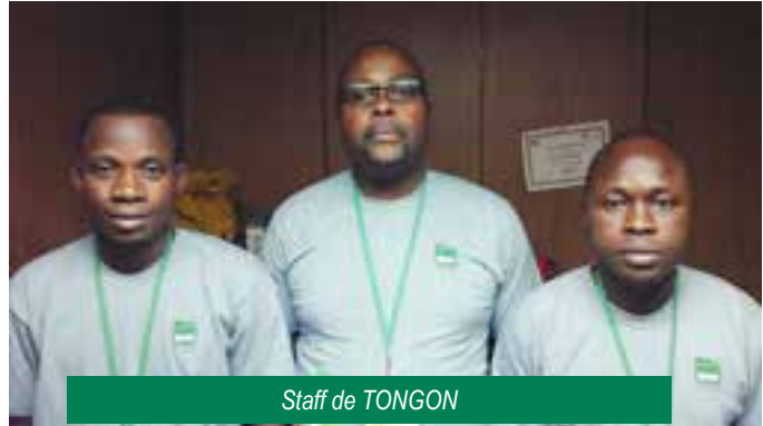
Staff de TONGON