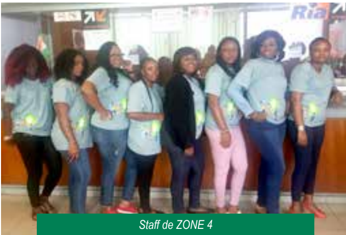
Staff de ZONE 4